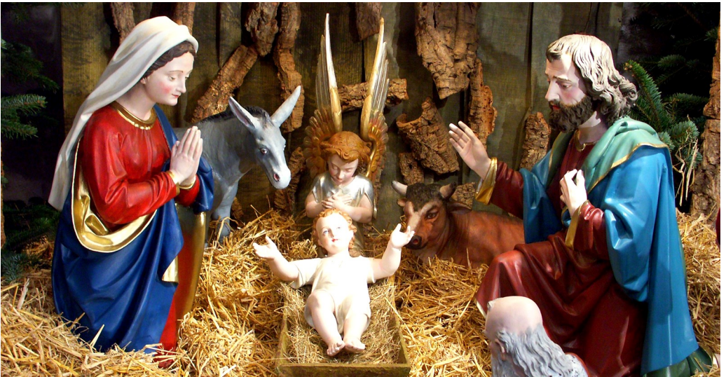
Krippe Sankt Josef, Bornheim