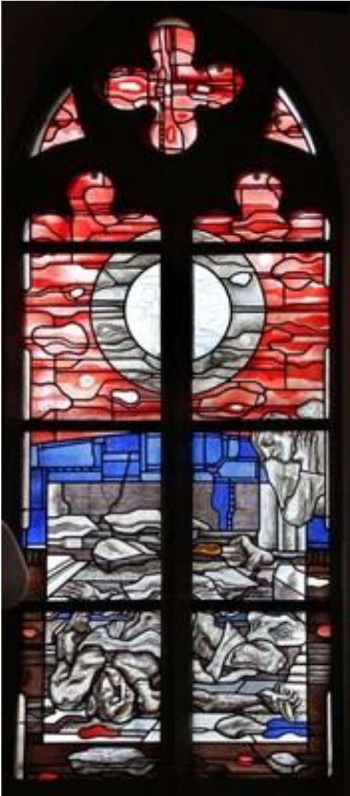
Die leiblichen Werke der Barmherzigkeit Glasfenster von Franz Meurer St. Elisabeth | Köln – Höhenberg

Seit alter christlicher Tradition gibt es die „Werke der Barmherzigkeit“, zu denen auch das Bestatten von Toten gehört.