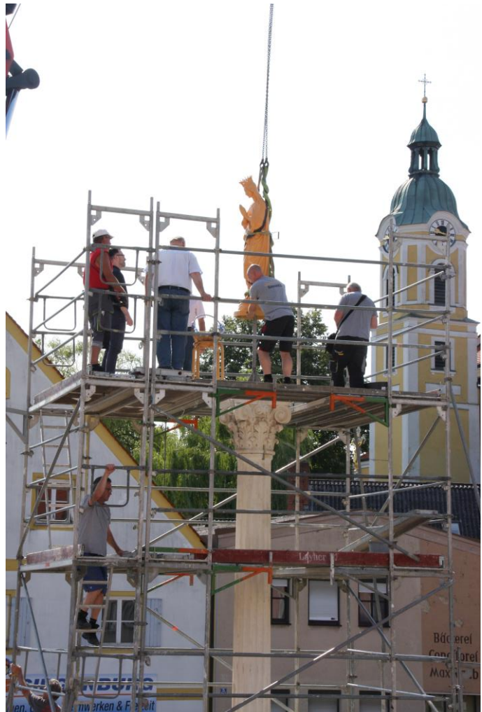
Bild rechts: Marienfigur (noch unvergoldet) kehrt zurück; Einsetzung der Zeitkapseln; Segnung