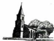
Maria, Hilfe der Christen