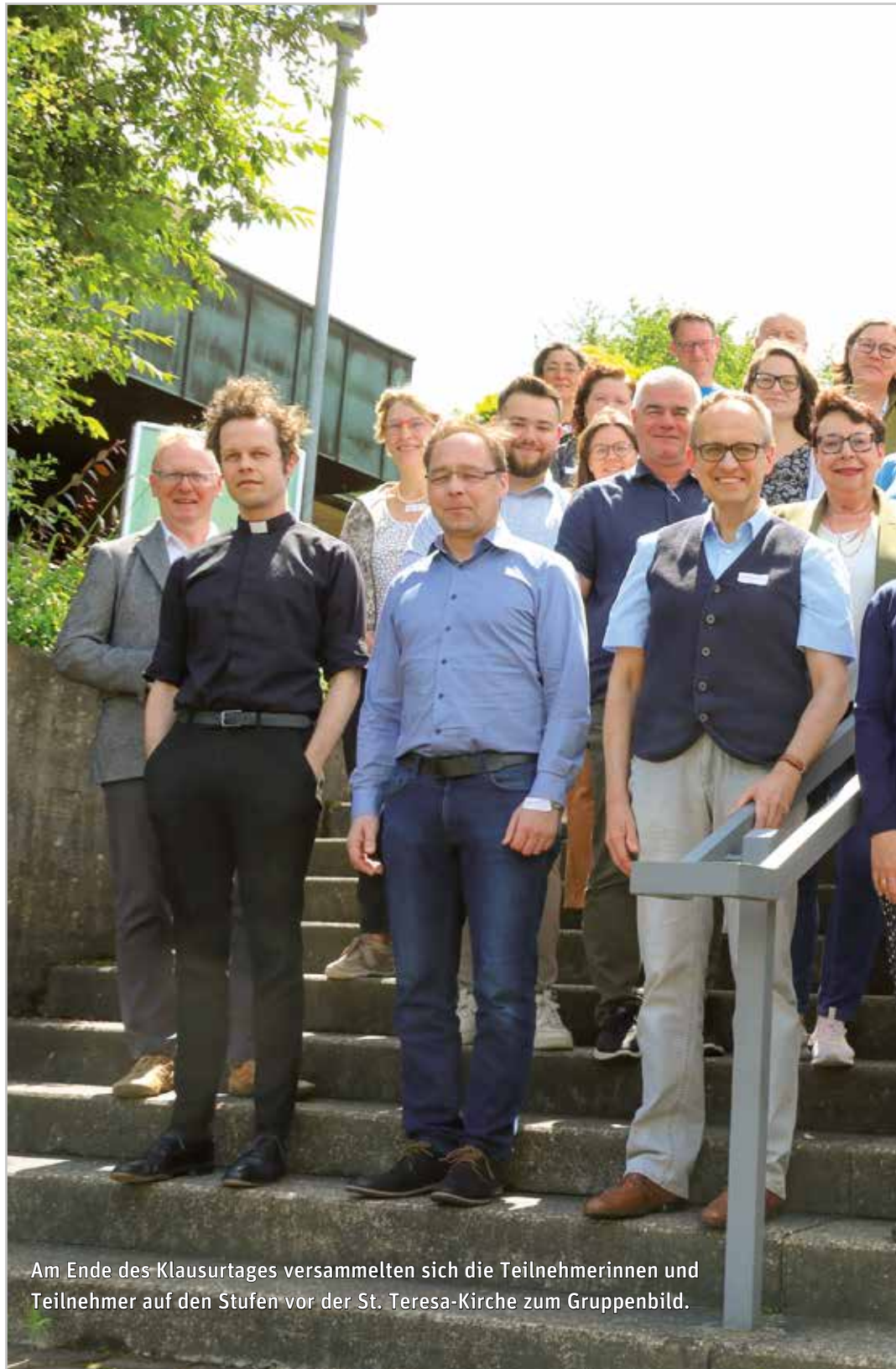
Am Ende des Klausurtagess versammelten sich die Teilnehmerinnen und Teilnehmer auf den Stufen vor der St. Teresa-Kirche zum Gruppenbild.

Aus den Ergebnissen der Kleingruppen schälten sich am Ende zehn Kriterien heraus, über die weitestgehend Konsens be-