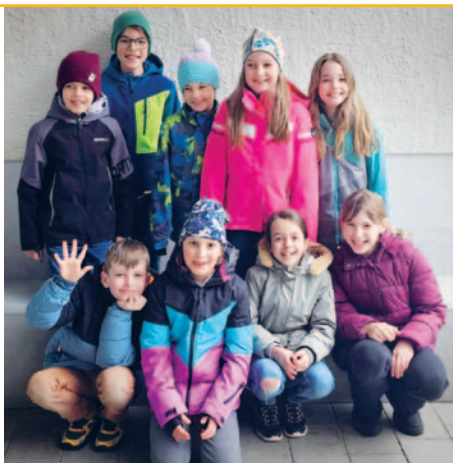
① EK-Kinder Region Bussnang-Tobel (Gruppe Affeltrangen)