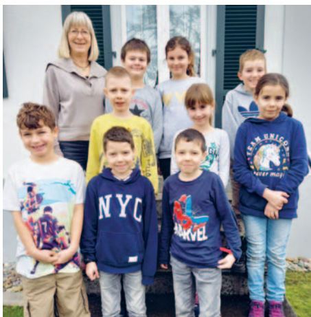
④ EK-Kinder Region Bettwiesen-Lommis