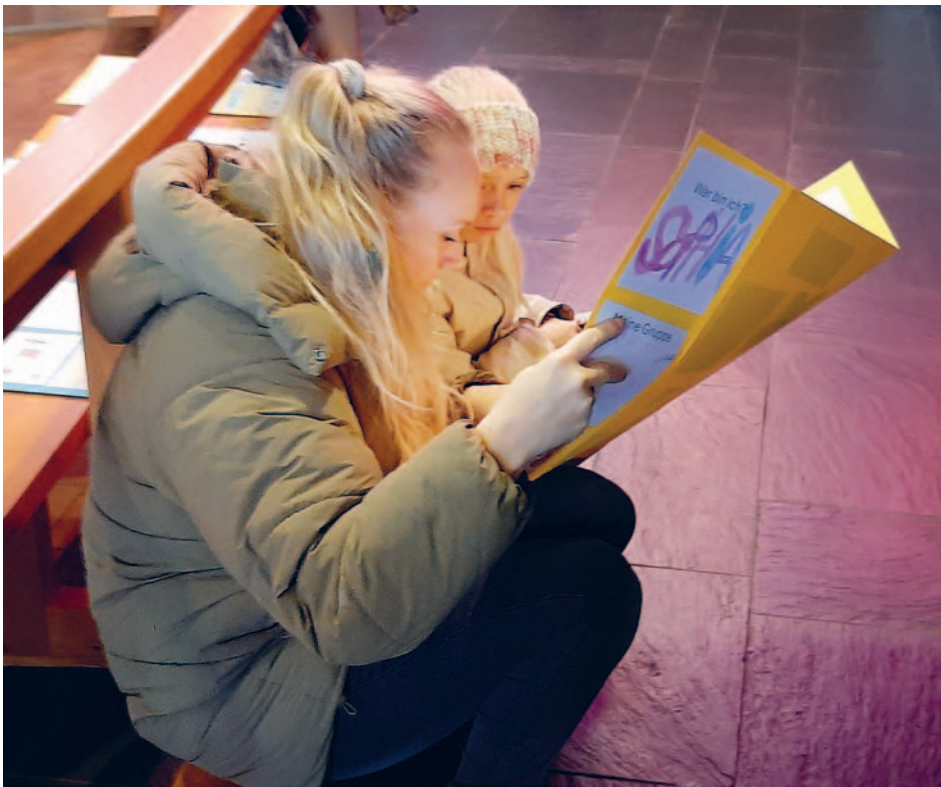
Vorbereitungstag der Erstkommunikanten