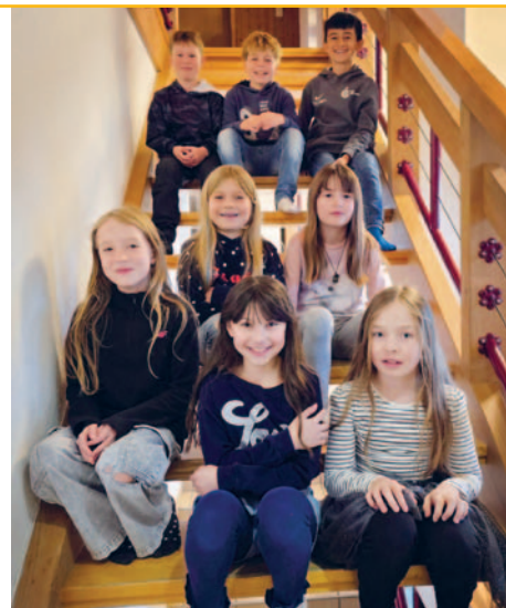
② EK-Kinder Region Bussnang-Tobel (Gruppe Tobel)