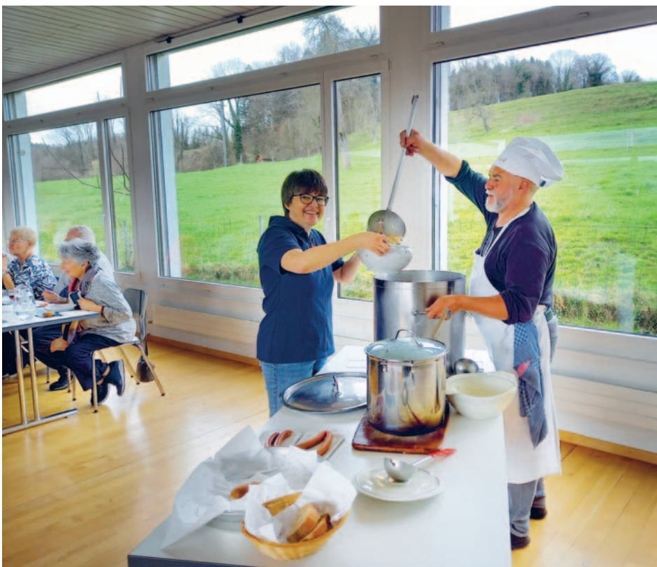
Ökum. Suppentag Sitterdorf

Das nächste Pfarreiblatt Nr. 9/2025 beinhaltet die Zeit vom 3. bis 18. Mai 2025. Eingabetermin ist der Mittwoch, 16. April.