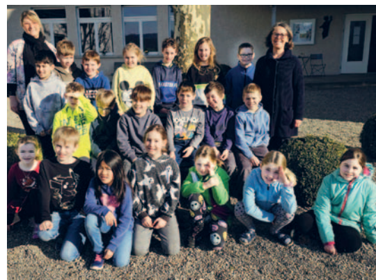
③ EK-Kinder Region Schönholzerswilen-Wuppenau