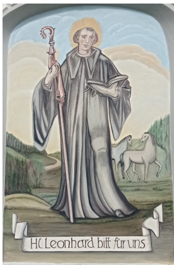
Foto: Außenfresko in Gottenau

Wir freuen uns auf Ihr Kommen und Mitfeiern!