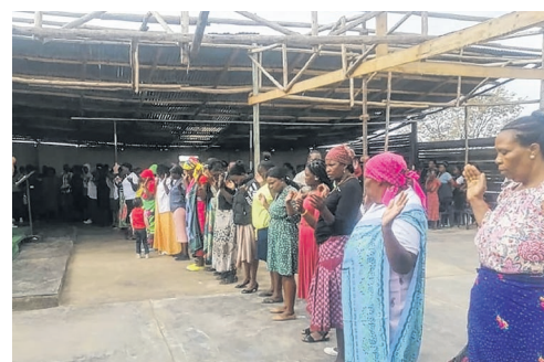
Gottesdienste in der Gemeinde von Namitwa.