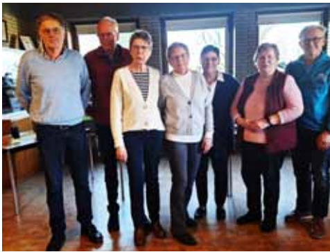
Planungsgruppe JuSe Aktiv.

Ein Jubiläum mit Herz und Gemeinschaft. Mit großer Beteiligung feierten wir am Sonntag, den 13. Februar unser 10-jähriges Jubiläum. Eine schöne Wanderung durch die Ickeraner Natur, gemütliches Beisammensein bei Kaffee und Kuchen im Pfarrheim sowie ein Rückblick auf unser abwechslungsreiches Programm der letzten Jahre machten den Tag besonders. Unsere Planungsgruppe wurde für ihr Engagement gewürdigt und mit viel Applaus bedacht.