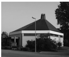
Kapelle St. Josef Marktplatz 31 68723 Schwetzingen- Hirschacker