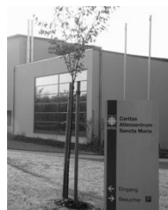
Kapelle im Caritas- Altzentrum (CAZ) Sancta Maria Schönauer Straße 2 68723 Plankstadt