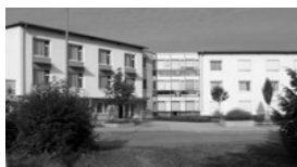
Kapelle im GRN Seniorenzentrum Bodelschwinghstr. 10/1 68723 Schwetzingen