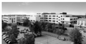
Kapelle im GRN Kreiskrankenhaus Bodelschwinghstr. 10 68723 Schwetzingen