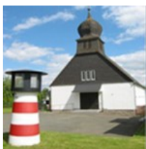
St. Bonifatius Semdenstr. 5 34513 Waldeck Sachsenhausen