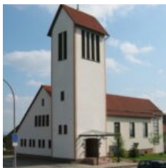
Maria Himmelfahrt Bahnhofstr. 5 34513 Waldeck