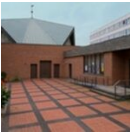
St. Liborius Fürst Friedrich Str. 6 34537 Bad Wildungen

5. Fastensonntag: L 1: Jes 43,16-21, L 2: Phil 3,8-14, Ev: Joh 8,1-11, L 1: Ez 37,12b-14, L 2: Röm 8,8-11, Ev: Joh 11,1-45 Palmsonntag: L 1: Jes 50,4-7, L 2: Phil 2,6-11 Ev: Lk 22,14-23,56 Ostersonntag: L 1: Gen 1,1-2,2, L 2: Gen 22,1-18, L 3: Ex 14,15-15,1, L 4: Jes 54,5-14, L 5: Jes 55,1-11, L 6: Bar 3,9-15.32-4,4, L 7: Ez 36,16-17a.18-28, Ev: Lk 24,1-12 2 Sonntag der Osterzeit: L 1: Apg 5,12-16, L 2: Offb 1,9-11a.12-13.17-19, Ev: Joh 20,19-31 3 Sonntag der Osterzeit: L 1: Apg 5,27b-32.40b-41, L 2: Offb 5,11-14, Ev: Joh 21,1-19