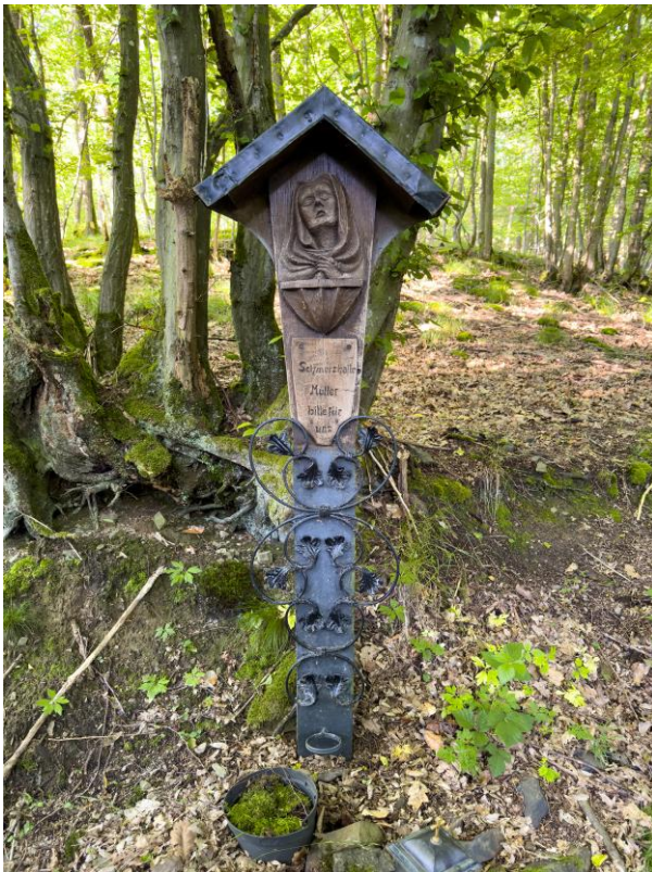
Bildstock an der Gemarkung Müllenbach

für die Zeit vom 31.08.2024 bis 30.09.2024