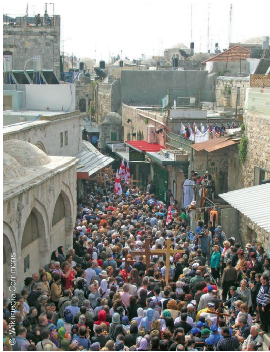
Kreuzwegsprozession in der via dolorosa, Jerusalem.

Darin liegt auch das Besondere und Unterscheidende des christlichen Auferstehungsglaubens: Keine andere Religion verehrt einen Gott, der sich selbst so radikal auf die Seite der leidenden Kreatur gestellt hat wie das Christentum. Jesus stirbt nicht wie ein erleuchteter, allem Leid enthobener Buddha. Er stirbt in unüberbietbarer Nähe zu jedem Leidenden, das heisst auch, in unmittelbarer Nähe zu jedem Opfer menschlicher