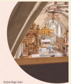
Kirche Sogn Gion in Domat/Ems Geschichte und Restaurierung Sonderdruck aus dem Broschürenverzeichnis 2024 Nr. 2