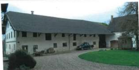
← Nagl-Hof Innenansicht