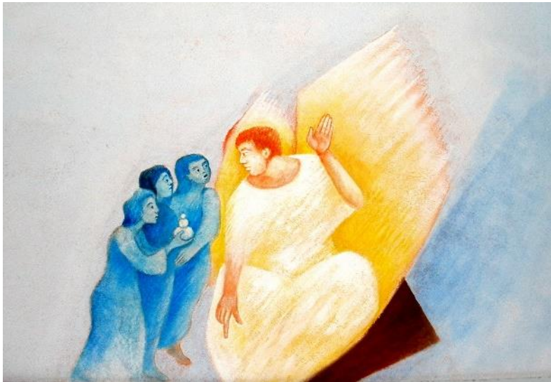
Bild: Friedbert Simon / Künstler: Polykarp Uehlein In: Pfarrbriefservice.de

Wir freuen uns mit den Erstkommunionkindern und ihren Familien und gratulieren herzlich!