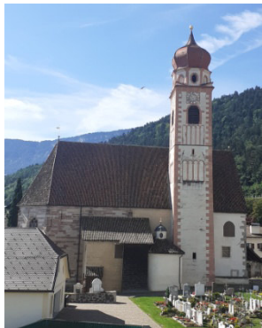
Maria Himmelfahrt Tisens