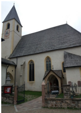
Unsere liebe Frau im Walde