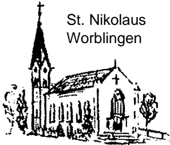
St. Nikolaus Worblingen