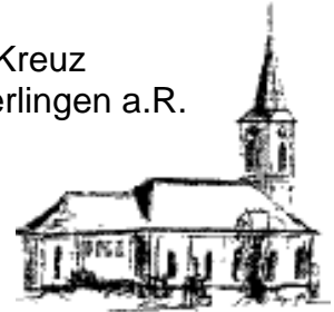
Hl. Kreuz Überlingen a.R.