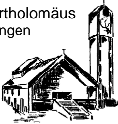
St. Bartholomäus Rielasingen