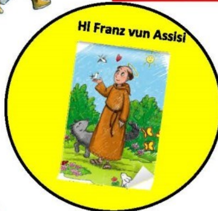
Hl Franz vun Assisi