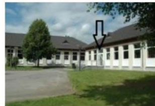
Centre Jean-Paul II, 2D, rue de la Fontaine L-8085 Bertrange

The entrance to Rue de la Fontaine is opposite the pharmacy, go straight ahead until you come to a courtyard.