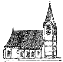
Johanniskirchen, St. Johannes d. Täufer