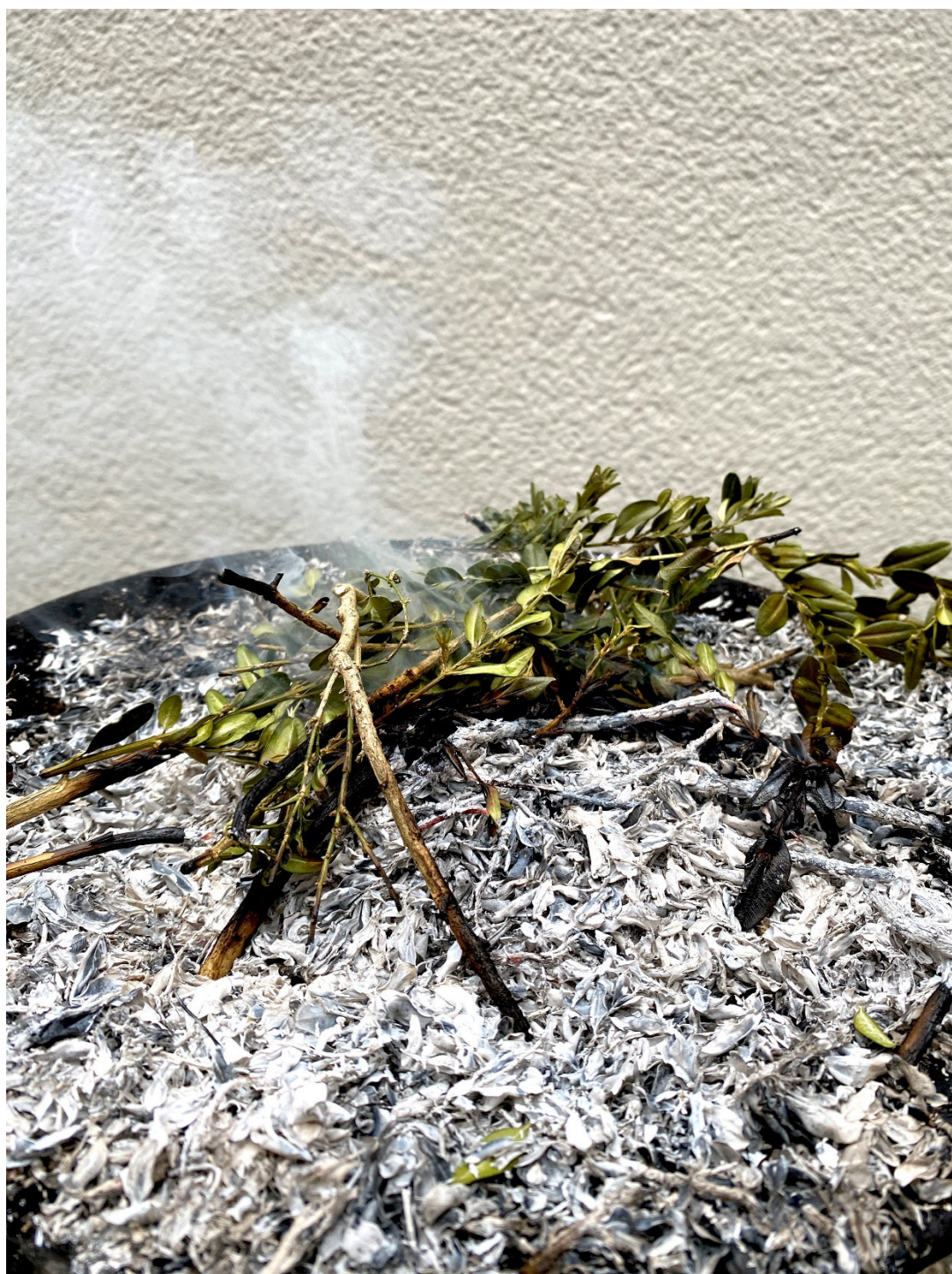
Bild „Herstellung der Asche für Aschermittwoch“

Termine und Informationen vom 22. Februar 2025 bis 09. März 2025