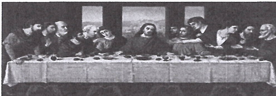
domradio.de: Gründonnerstag – letztes Abendmahl