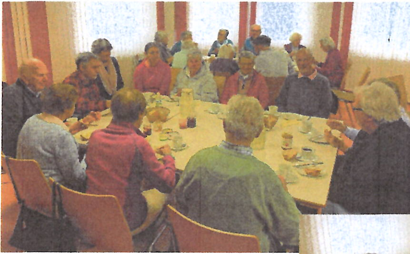
Gemeinsames Frühstück nach dem Morgengebet.

Weitere Morgengebete sind am Montag, 31.03., 07.04., 14.04.2025.