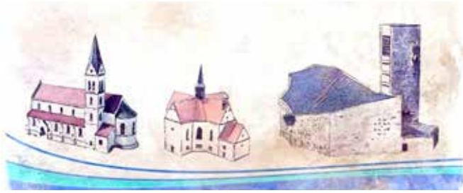
St. Salvator - St. Korona - St. Konrad