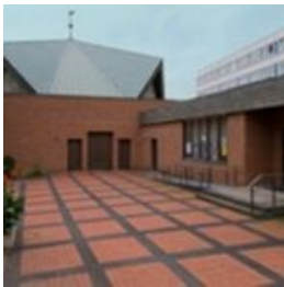
St. Liborius Fürst Friedrich Str. 6 34537 Bad Wildungen