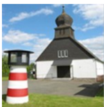
St. Bonifatius Semdenstr. 5 34513 Waldeck Sachsenhausen