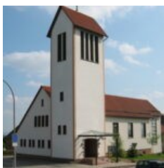
Maria Himmelfahrt Bahnhofstr. 5 34513 Waldeck