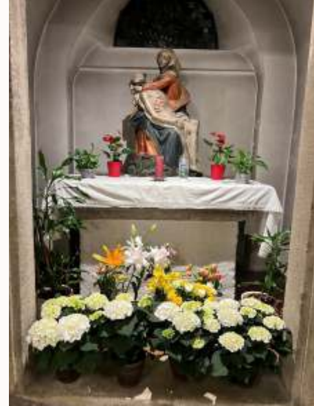
Osternacht in Gerasdorf