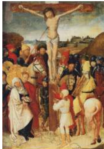
Heilig-Blut-Tafel der Abtei Weingarten

Vom 10. Jahrhundert an entstanden lokale Feste zur Verehrung des „Kostbaren Blutes Christi“.