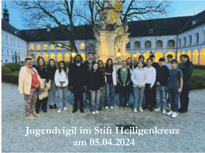
Jugendvigil im Stift Heiligenkreuz am 05.04.2024