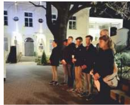
Osternacht in Seyring