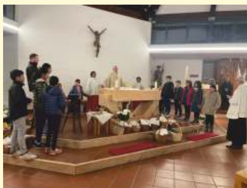
Osternachtsfeier mit WB Scharl