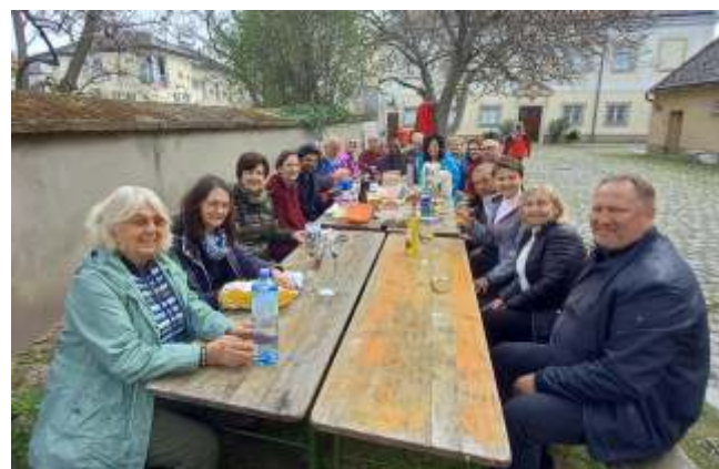
Emmausgang - Jause