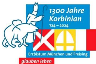
Logo des Bistumsjubiläums

2024 feiert die gesamte Erzdiözese München und Freising ein lebendiges Fest des Glaubens.