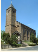
St. Bartholomäus Boos