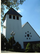
St. Dionysius Bermel