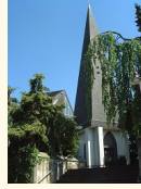
St. Stephanus Nachtsheim