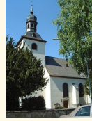
St. Kastor Weiler