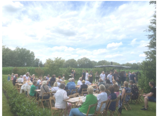
Impression vom "Katerfrühstück" in Uptloh. Diesmal bei Övermöhle im Kattenpohl

„schwierigen“ Zeiten angeschlagenen Schützen wieder aufhelfen sollten.