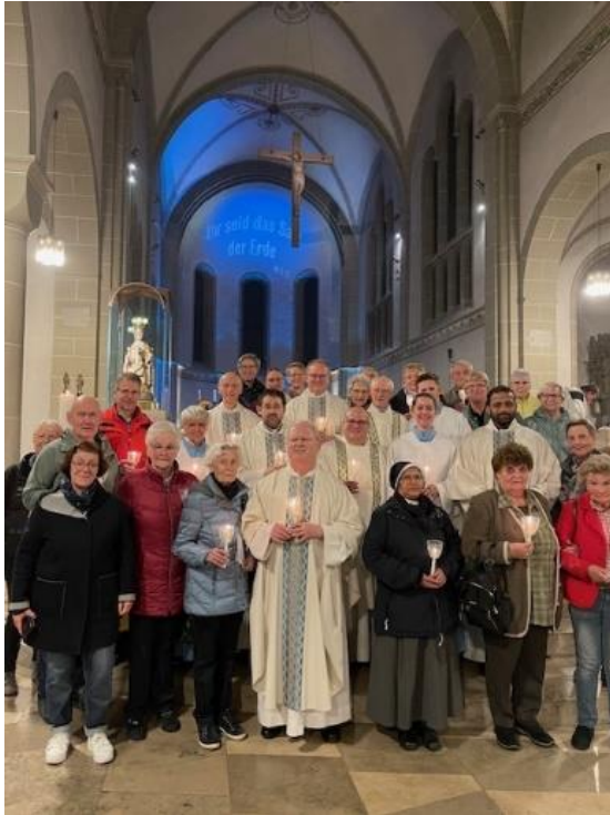
Die Pilgergruppe in Werl