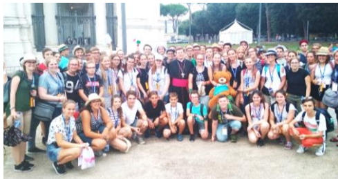
Teilnehmer der letzten Romwallfahrt 2018

Am Sonntag, 28. Juli, sind unsere Ministrantinnen und Ministranten zur Romwallfahrt aufgebrochen. Im nächsten Pfarrblatt werden wir über die Reise berichten. Unter www.mehr-als-messdiener.de/rom-news können Sie die Reise live verfolgen. Schon jetzt danken wir allen Spenderinnen und Spendern für die Unterstützung.