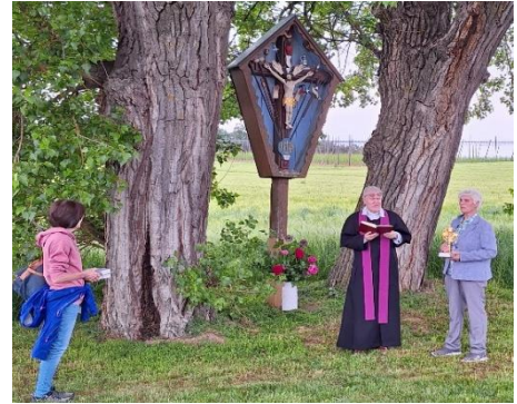
Text u. Bild: Monika Schrödl

Der Bittgang führte von Güntersdorf über Dietersdorf nach Ampertshausen. Dort wurde in der Kirche ein Schaueramt mit Pfr. Alexander Weber gefeiert. Anschließend setzten die Bittgänger die Prozession nach Aufham fort. An den Feldkreuzen wurde kurz Andacht gehalten.