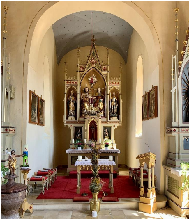
St. Georg Großinzemoos