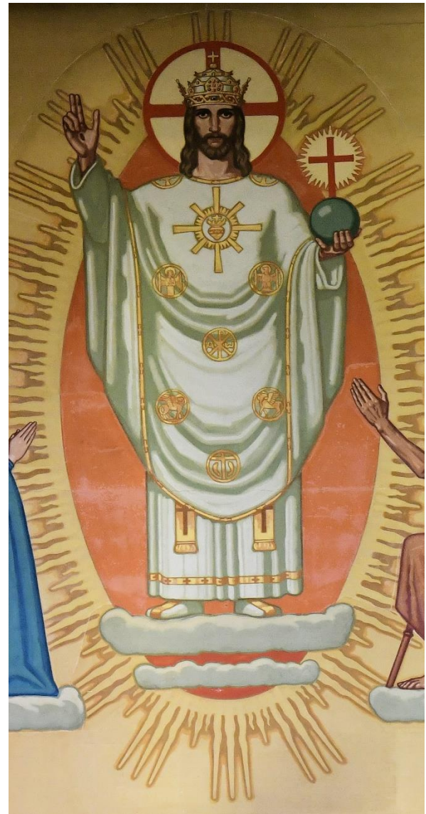
Klosterkirche Baldegg Schweiz