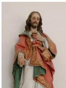
© Andrea Felden, Herz Jesu, Freilingen

Im Monat Juni wird besonders das Herz Jesu in den Mittelpunkt gerückt, wie im Mai und im Oktober die Gottesmutter. Wenn wir sagen, jemand habe ein Herz für einen Menschen, dann drücken wir damit das Persönlichste aus, was unsere Sprache ins Wort fassen kann. Wir dürfen auch davon sprechen, dass Gott ein Herz für uns Menschen hat. In seinem Herzen finden alle ihren Platz, nicht nur die Funktionstüchtigen, sondern auch die Schwachen und besonders die Unmündigen. Sie wissen, dass sie Gott nichts bieten können und ganz auf seine Liebe angewiesen sind. Davon hat uns Jesus die Kunde gebracht. Himmel und Erde würden zum Fest, wenn sich alle von seiner Liebe finden ließen. Wir feiern das Hochfest des Herzens Jesu am Freitag, 7. Juni 2024 um 19:00 Uhr in den Gottesdiensten in Baasem und Freilingen.