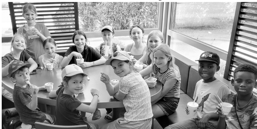
Jungscharabschluss beim McDonalds