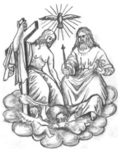
Hl. Dreifaltigkeit Ränkam