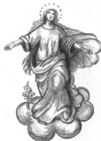
Mariä Himmelfahrt Furth im Wald