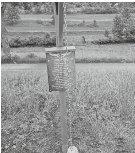
Der keltische Wetterstein