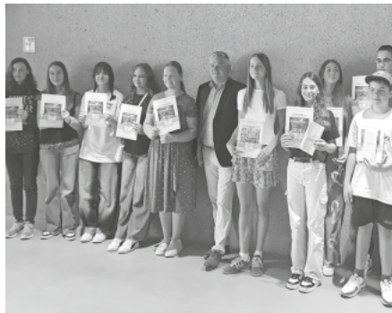
Alle Preisträger mit Herrn Reichegger

OP (=Ortspreis), LP (=Landespreis), BNP (=Bundespreisnominierung)