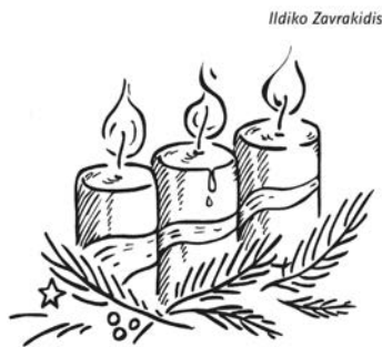
3. Advent: Der Verheißung trauen