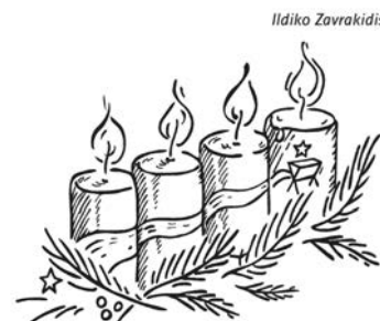
4. Advent: Dem Licht folgen