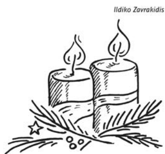
2. Advent: Die Erwartung wecken