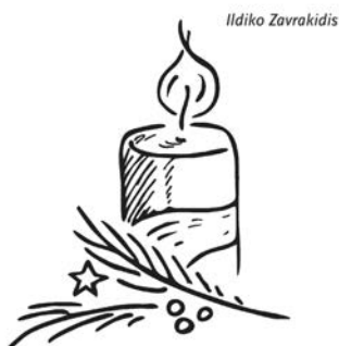
1. Advent: Die Umkehr wagen