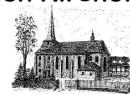
St. Laurentius Gieboldehausen