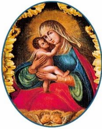
MARIA HILF MOOSBRONN

275 Jahre Pfarr-und Wallfahrtskirche Maria Hilf, Moosbronn