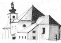
St. Bartholomäus Hohenthan