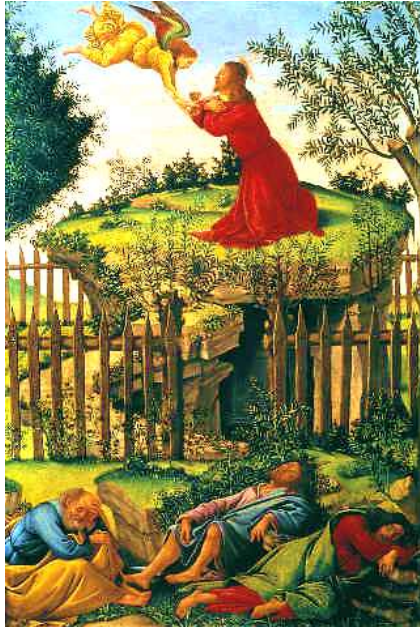
Sandro Botticelli: Christus am Ölberg. 1499