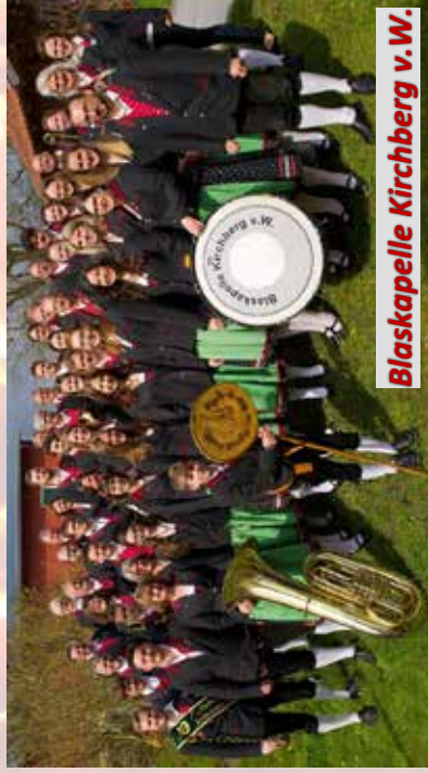
Blaskapelle Kirchberg v.W.

Auf Euren Besuch und einen schönen und geselligen Abend in gemütlicher Atmosphäre freut sich die ganze FFW Patraching. Die Einnahmen kommen der Mannschaft zugute und werden überwiegend in die Ergänzung der persönlichen Sicherheitsausrüstung investiert.