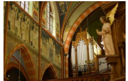
Église St Martin Dudelange

Mir all sinn agelueden op eisem Wee duerch d'Geschicht Pilgerinnen a Pilger vun der Hoffnung ze sinn.