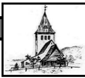
St. Jodokus Bad Oberdorf