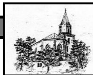
St. Johannes Bad Hindelang

der katholischen Pfarreiengemeinschaft Bad Hindelang