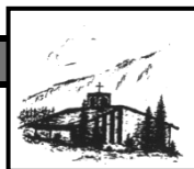
Heilig Geist Oberjoch