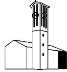
St. Johannes Bosco