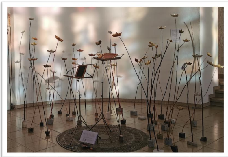
„Gedankenschiffchen“ von der Künstlerin Angelika Nette „Alle Menschen werden Brüder...“

Gottesdienste | Informationen | Veranstaltungen