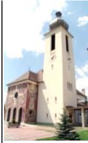
Pfarre Wimpassing im Schwarzatale