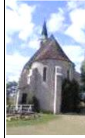
Pfarre Dunkelstein- Blindendorf