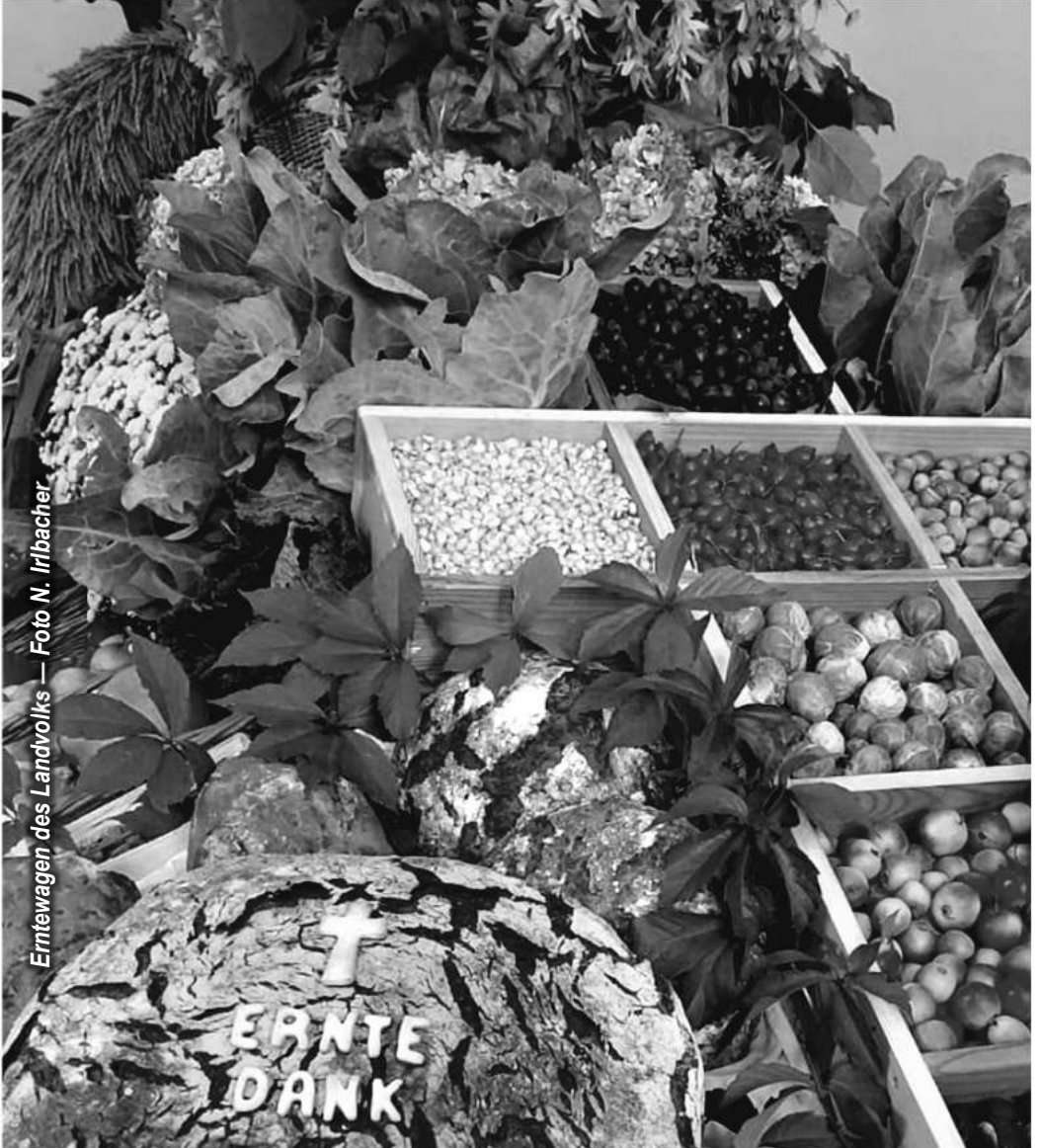
Erntewagen des Landvolks