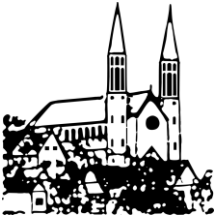
St. Johannes Forbach