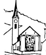
Maria Königin Au im Murgtal