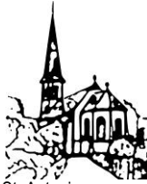
St. Antonius Bernersbach