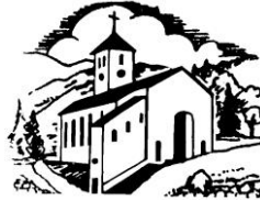
St. Valentin Langenbrand