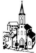
St. Wendelin Weisenbach