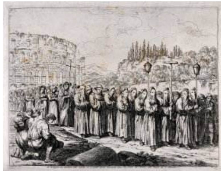
Prozession nach der Kreuzwegandacht im Kolosseum, an der Spitze die Büberbruderschaft der Sacconi; Kupferstich, Bartolomeo Pinelli, 1820

Als im Geist der Gegenreformation Andachtsformen der Kreuzesmystik besondere Förderung erfuhren, trugen li-