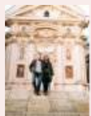
COVERBILD: ERLEBNISREGION GRAZ

Die Erlebnisregion Graz lädt ein, Graz und die Stadtkrone neu zu entdecken: www.regiongraz.at